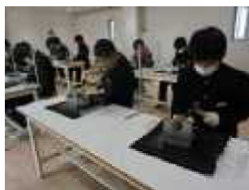
タンブラー（銅製グラス）制作

このような充実した修学旅行にすることができたのは、企画してくださった旅行会社の方や先生方、クラスメイトの協力のおかげだと思います。生徒全員がたくさんいい思い出をつくれたことは、修学旅行委員長として、とてもうれしいです。