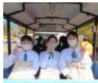
サントピアワールド