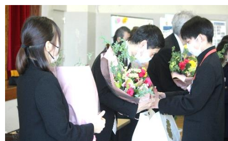
学年主任・担任への花束贈呈